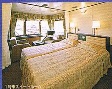
1号車スイートルーム