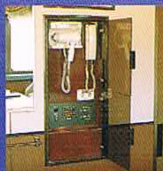
スイートルームは1号車と2号車に ございます。

列車ならではの楽しみと列車を忘れさせる心地よさをお届けする、トワイライトエクスプレスの貴賓室、それがスイートルームです。列車内の空間を贅沢に独占。壁面はぬくもりのある木目調、カーテンや絨毯も、洗練されたカラーで統一。1号車のスイートルームでは、三方に広がる車窓から美しく表情を変える沿線の風景を存分にご覧いただけます。寝台車としては稀なツインベッドやエキストラベッドにもなるソファを完備。そしてシャワールーム、大型の液晶モニター、冷蔵庫、電気ポット、ドライヤーからバスローブ、トラベルセットにいたるまで、走る豪華ホテルの名にふさわしい快適な設備もご用意しております。どうぞ、思い思いのスタイルで、かけがえのない旅のひとつをおくつろぎください。