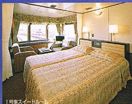
1号車スイートルーム