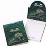
ポップミニデスクメモ ¥350

子供用サイズ(16~20cm)のくるぶし丈ソックスです。お孫さんのおみやげに!!