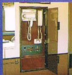
スイートルームは1号車と2号車に ございます。

列車ならではの楽しみと列車を忘れさせる心地よさをお届けする、トワイライトエクスプレスの貴賓室、それがスイートルームです。列車内の空間を贅沢に独占。壁面はぬくもりのある木目調、カーテンや絨毯も、洗練されたカラーで統一。1号車のスイートルームでは、三方に広がる車窓から美しく表情を変える沿線の風景を存分にご覧いただけます。寝台車としては稀なツインベッドやエキストラベッドにもなるソファを完備。そしてシャワールーム、大型の液晶モニター、冷蔵庫、電気ポット、ドライヤーからバスローブ、トラベルセットにいたるまで、走る豪華ホテルの名にふさわしい快適な設備もご用意しております。どうぞ、思い思いのスタイルで、かけがえのない旅のひとつをおくつろぎください。