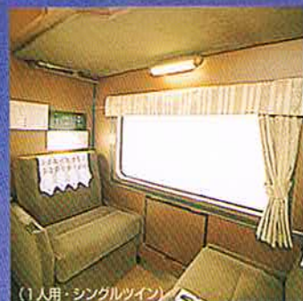
(1人用・シングルツイン)