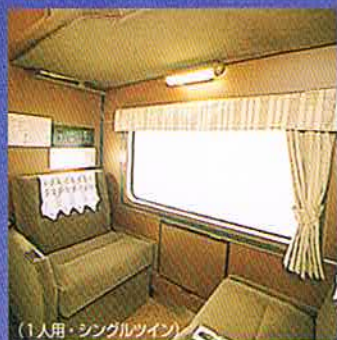
(1人用・シングルツイン)