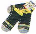
くるぶしソックス ¥500

子供用サイズ(16~20cm)のくるぶし丈ソックスです。お孫さんのおみやげに!!